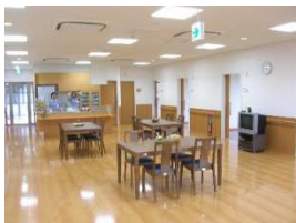
食堂兼多目的ホール

認知症の方が入居され、食事の支度や掃除、洗濯などをスタッフと共同で行い、家庭的で落ち着いた雰囲気の中で生活を送る小規模な施設です。少人数の中で「なじみの関係」をつくることによって心身の状態を穏やかに保ち、役割を持ってイキイキとした生活を送れるようスタッフがサポートいたします。