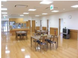
食堂兼多目的ホール

認知症の方が入居され、食事の支度や掃除、洗濯などをスタッフと共同で行い、家庭的で落ち着いた雰囲気の中で生活を送る小規模な施設です。少人数の中で「なじみの関係」をつくることによって心身の状態を穏やかに保ち、役割を持ってイキイキとした生活を送れるようスタッフがサポートいたします。